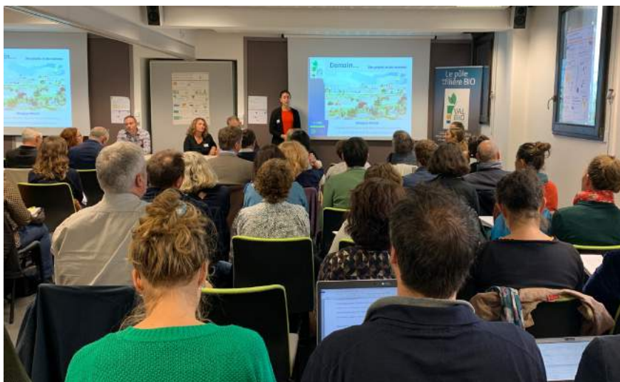
90 participants à la rencontre « nord » du 17 octobre à St Jean d'Angély ayant pour thème « Filières alimentaires et économie du territoire »

- En Nouvelle-Aquitaine, on dénombre 15 Projets Alimentaires de Territoire donnant un cadre stratégique et opérationnel à des actions partenariales répondant à des enjeux sociaux, environnementaux, économiques et de santé et où l'alimentation devient un axe intégrateur et structurant de mise en cohérence des politiques sectorielles sur le territoire. Trois d'entre eux ont d'ores et déjà été labellisés par le Ministère de l'Agriculture et 5 sont en cours de labellisation. A cela s'ajoute une vingtaine de projets en émergence et une cinquantaine sur les circuits alimentaires locaux dont une forte majorité aborde l'approvisionnement local de la restauration collective.